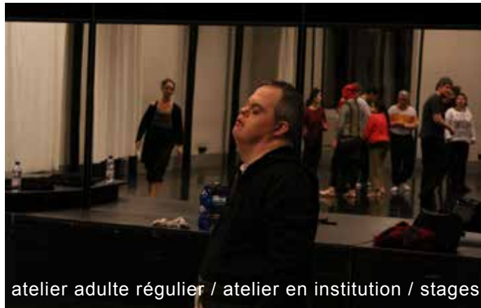
atelier adulte régulier / atelier en institution / stages