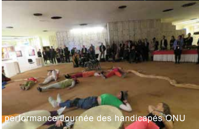
performance Journée des handicapés ONU