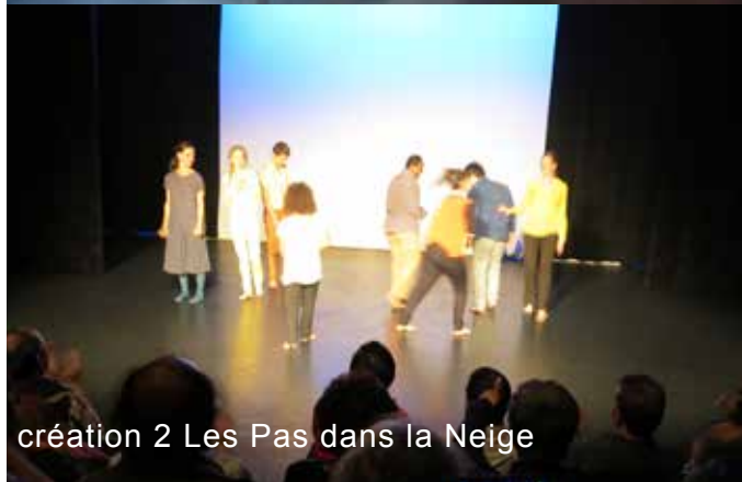
création 2 Les Pas dans la Neige