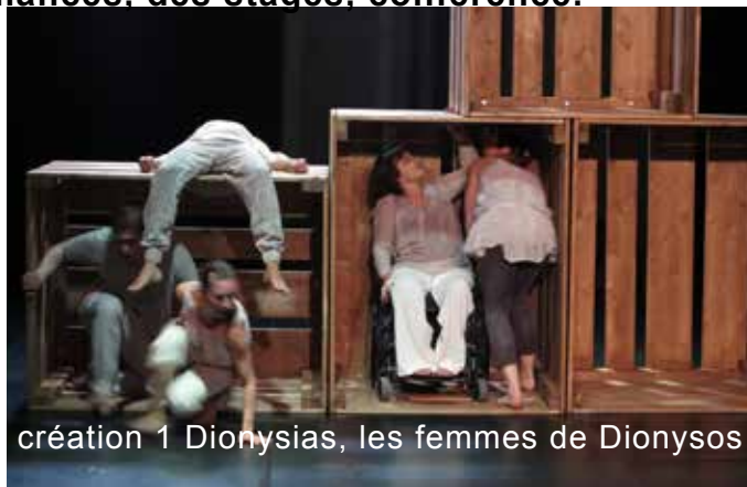
création 1 Dionysias, les femmes de Dionysos